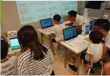
※株式会社紀伊國屋書店 玉川高島屋店様