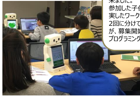
※練馬区立 大泉図書館様

図書館職員が準備から講師まで行うための研 修資料が揃っており、不安なく実施することが出 来ました。